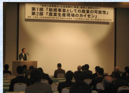
「地域力連携拠点事業 農商工連携セミナー」～平成22年1月25日開催

北海道の強みである「農業」をさらに伸ばし、道内経済の活性化に貢献するため、様々な取組みを実施しております。支援体制のさらなる充実を図るため、平成21年6月には、「アグリビジネス推進室」を新設いたしました。