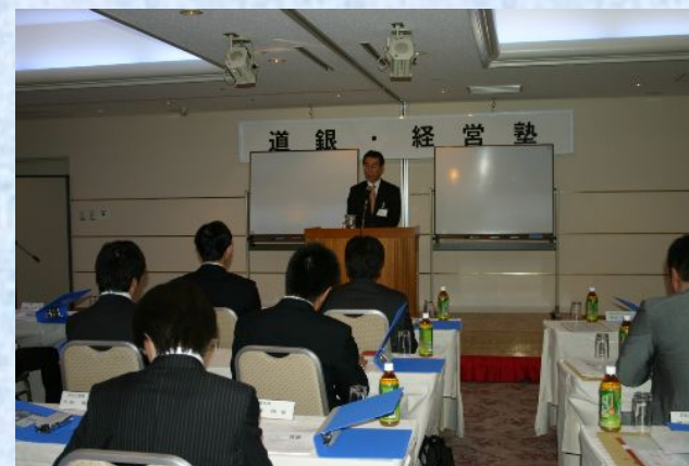
道銀経営塾の講義風景

この他にも、単独で対応することが難しい事業承継のノウハウについて、本部専門スタッフによるきめ細やかな提案を実施しております。