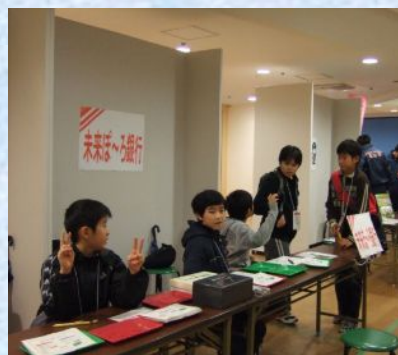
小学生の就業体験イベントに「未来ぼーろ銀行」として参画（21/11）