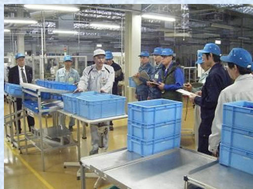
「モノづくり現場管理者実践研修会」～平成22年11月9日～11日開催

製造業の成長、経営改善に向けた支援のために、様々な取組みを実施しております。その中の一つとして、製造業の現場管理監督者を対象として、「カイゼン活動」を社内で中心となって行う人材を育成する愛知県内(2泊3日)の企業研修を実施しました。