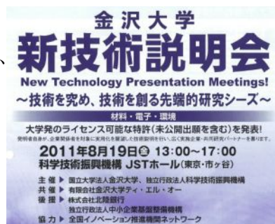
東京地区取引先81社、83名が参加

首都圏に店舗網を広く構える当行の特色を活かして、多数の東京地区お取引先を誘致し、技術移転の促進を図りました。