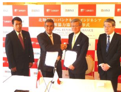
バンク・ネガラ・インドネシアとの調印式

海外進出および海外ビジネスをサポートするため、平成23年4月に、インドネシアの銀行「バンク・ネガラ・インドネシア」と業務協力協定を結びました。（右の写真）同目的で、平成23年8月には中国紹興市との経済交流で提携を行っております。