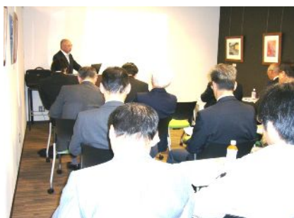
セミナーの様子（高岡開催）

平成23年7月に、中小企業支援ネットワーク強化事業の一環として、農業博士を招いての、農商工連携における助成制度などについて、事例を交えた講習会を行いました。計30名のお取引先にご参加いただきました。