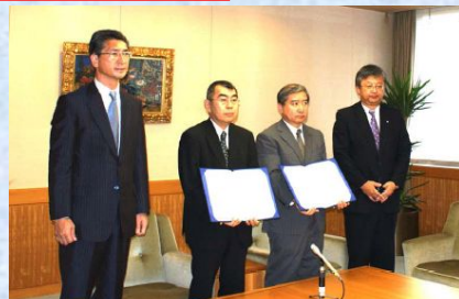
日医IMP I との業務提携（産業調査部が主担）

工場見学への同行、業種別や産業構造の分析、外部機関との提携などを通じ、コンサルティング能力の底上げを行います。