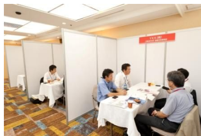
商談ブースの様子