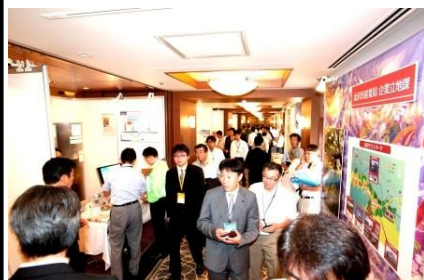
展示ブースの様子

平成23年8月に、大垣共立銀行と共催で、「モノづくり」がテーマの商談会を開催。当行の広域店舗網を生かした首都圏大手バイヤー企業の招聘や、金沢大学理工学域、富山大学の特別協力による地元メーカーの技術力評価により、実のある商談の実現を支援。約1,500名の来場、約1,000件の商談が行われました。