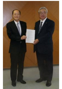
調印時の様子 (平成26年5月)

道内における中小企業の健全な発展を図るため、北海道税理士会と中小企業支援に関する覚書を締結しました。この覚書には北海道税理士会と当行が中小企業支援等に係る業務を通じて、北海道経済の発展に寄与することを目的に、相互に協力し活動することを織り込んでおります。本提携により、お取引先の経営改善、資金調達能力強化に繋がると考えており、これからも地元地域への円滑な資金供給および発展に貢献してまいります。