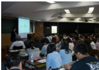
金沢大学での講義の様子 (平成26年5月)

平成26年度上半期は、金沢大学や富山大学において、前期通期で講義を実施し、金沢工業大学・金沢星稜大学・富山県立大学においても1～6コマの講義を実施しました。当行では、将来の地域を担う若い世代への各種教育を通じ、長期的視野での地域貢献に資する取組みを行っております。