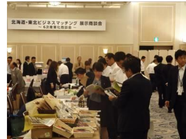
商談会の様子(平成26年6月)

今回は、平成25年11月に開催した「東北・北海道6次産業化ビジネスフォーラム」の参加企業を個別にフォローし、商談成約や新事業展開に向けたバックアップを実施したことが特徴です。