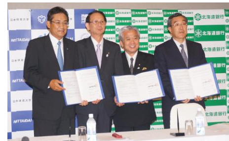
調印式の様子(平成26年8月)

学校法人日本体育大学、株式会社道銀地域総合研究所および北海道銀行の3者で、包括連携協定を締結いたしました。学校法人日本体育大学が網走市で計画する知的障害者特別支援教育の実践の中で、3者の相互協力によって、地域産業にマッチした職業訓練等の調査研究、卒業生の受け皿環境の調査や情報支援、また道内企業や医療機関との連携についての調査・研究・紹介などを行い、相互の発展、社会貢献、地域振興の実現を目指すものです。