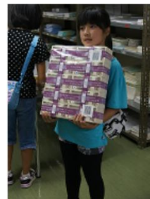
銀行体験の様子 (平成26年8月)

小学生とその保護者の方を対象とした「夏休み親子で銀行体験」を札幌、函館、小樽、室蘭、苫小牧、旭川、釧路、北見、帯広の道内9都市で開催しました。