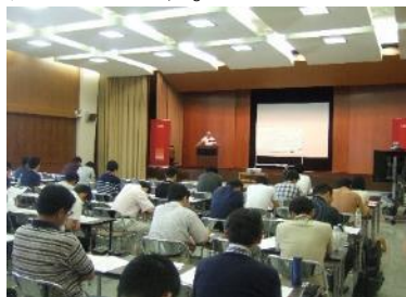
勉強会の様子(平成26年6月)

平成26年度上半期は「不動産」をテーマに、オフィスビル・賃貸住宅・ビジネスホテルの収益還元手法について講義を行い、403名の行員が参加いたしました。