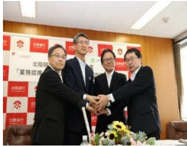
調印時の様子(平成26年8月)

平成26年8月、創業支援、ベンチャー企業支援、農商工連携、経営革新等、中小企業者、農林水産業者の振興に資することを目的に日本政策金融公庫富山支店、金沢支店、福井支店と連携協定を締結しました。互いの強みを活かして連携を図り、協調融資等をはじめとした、地域経済の活性化に資する取組みを進めてまいります。