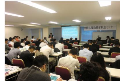
セミナーの様子(平成26年7月)

公益財団法人国際人材育成機構の協力のもと、外部から講師を招き、外国人技能実習制度にかかるセミナーを開催しました。北海道においても建設業を中心に人材不足は深刻な問題であり、東南アジアなどから実習生を受け入れ活用して