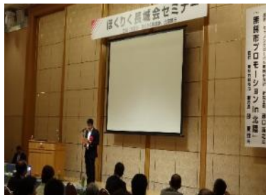
セミナーの様子(平成26年9月)

当行の会員組織である「ほくりく長城会」の会員向けセミナーの講師として、当行が業務提携を結んでいる中国江蘇省無錫市招商局より副局長をお招きし、無錫市の産業や経済を紹介いただきました。