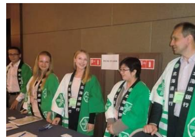
交流会の様子(平成26年6月)

ウラジオストク海外駐在員事務所開設(平成26年3月)を記念し、当行ロシア室は北海道と「道銀ロシア極東ビジネス交流会」を開催しました。本交流会では、相互理解を深めるため、現地のビジネス視察や自社P