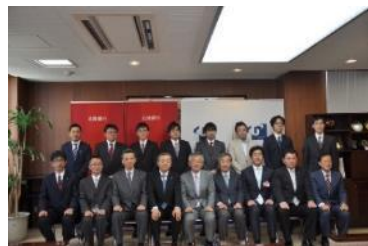
富大ほくぎん若手研究者助成金贈呈式 (平成26年5月)

金沢大学・富山大学において若手研究者に各々500万円を毎年助成しております。将来有望な若手研究者への支援を通じて学術研究発展に寄与する取組みを継続して実施しております。