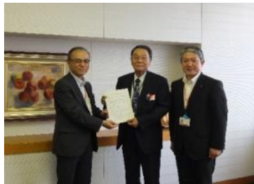
富山県中小企業診断協会との提携 (平成26年9月)

北陸・北海道地区において、各地区の中小企業診断(士)協会との業務提携を行いました。地域事情や該当業種にも理解のある地元の中小企業診断士による、事業計画策定やモニタリングなどのサポート体制を強化しました。