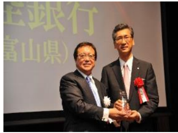
受賞時の様子 (平成26年6月)

中小・中堅企業M&A仲介機関大手の(株)日本M&Aセンターと連携し、富山・高岡・石川・福井の4会場で個社別株価診断会を実施しました。また、多くのM&Aニーズを発掘し、事業承継問題を解決するM&Aを成約したとして同社から表彰を受けました(平成25年度実績)。