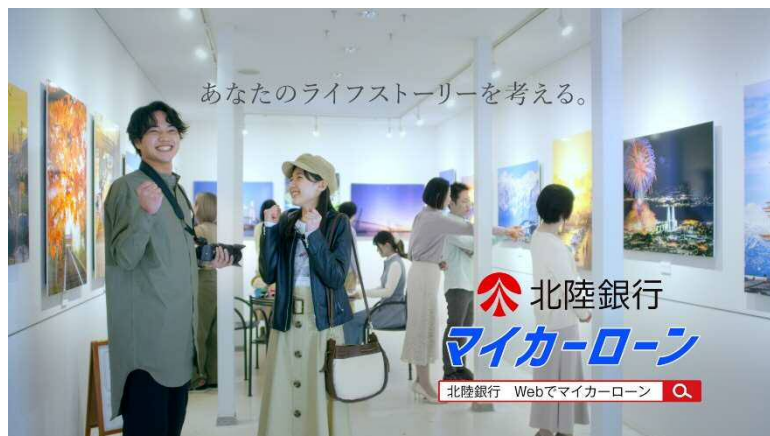
テレビCM「新しい景色篇」より