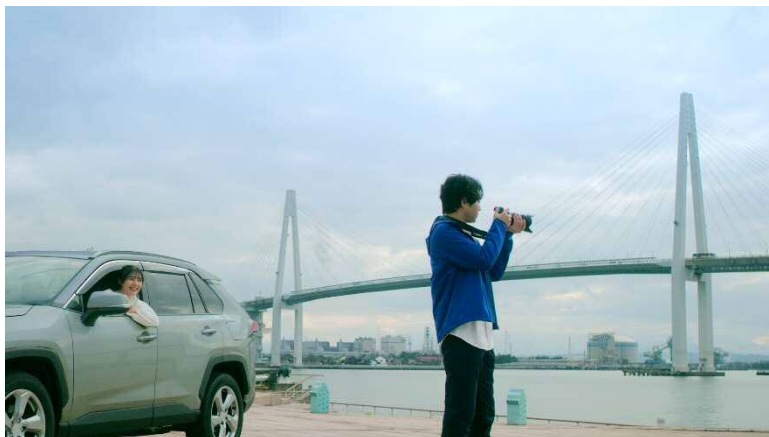
テレビCM「新しい景色篇」より

さらに、「ホクリクの本気 ほくぎん×イナガキヤスト」プロジェクトと一緒に取り組むフォトグラファー・イナガキヤストさん（富山県出身）が撮影した写真も登場します。