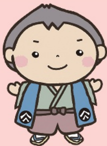
北陸銀行 キャラクター ほくまる