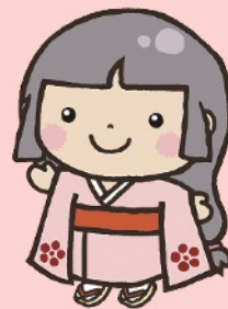
北陸銀行 キャラクター りくひめ