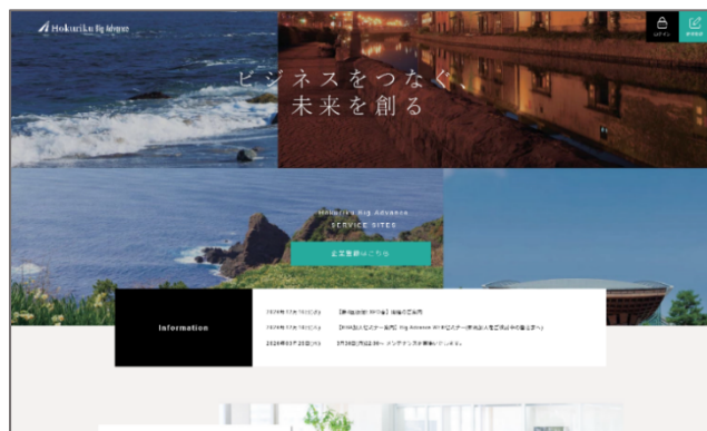
<Hokuriku Big Advance トップ画面>

本キャンペーンは、当行が Big Advance の運用を開始し1年が経過したこと、2020年11月に「Big Advance 公式アプリ」が登場し、さらに使い勝手が向上したことを記念し、日頃のご利用に感謝の意を表したものです。