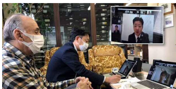
取引先A社 (写真左) と両行行員との打ち合わせ

北陸銀行取引先A社が販売しているワインを北海道ニセコのホテルへ納入出来ないかを検討