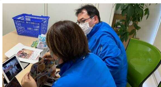
取引先B社 (写真) とC社 (リモート) の商談

両行に取引がある函館市内B社の食品販売に向けて札幌市内の北海道銀行取引先C社と商談